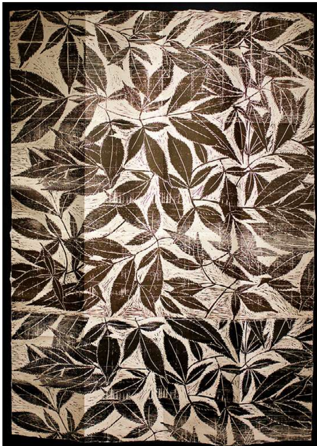
Sambucus Xilografía 60 x 83,5 cm 2023