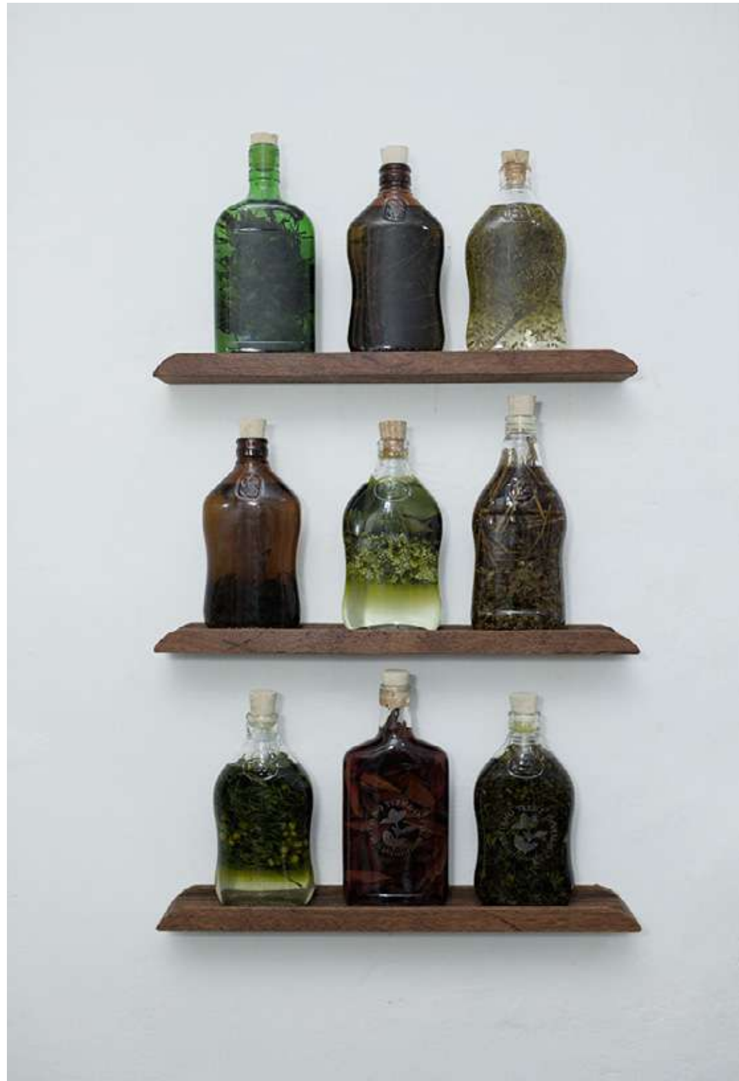
Brujería Instalación Variables 2023