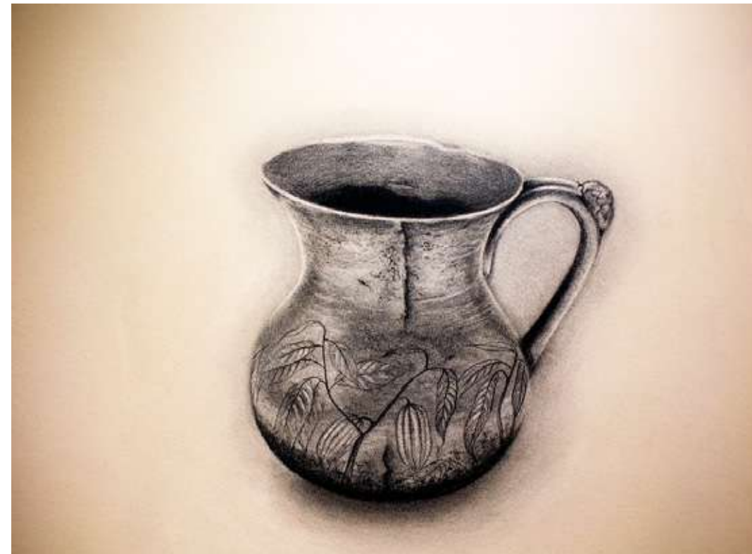
Cacao Dibujo al carboncillo 60 x 83,5 cm 2023