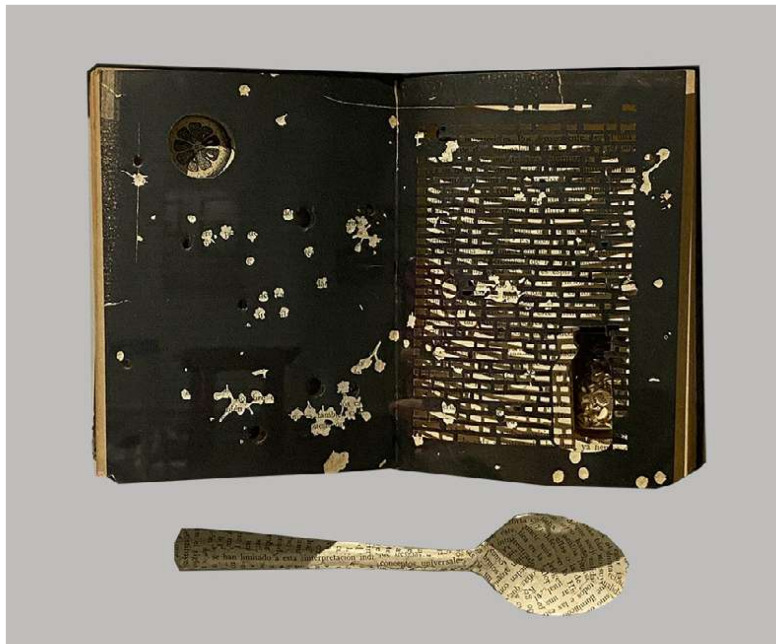
Jarabe Libro intervenido y collage 35,3 x 32,4 cm (enmarcado) 2023