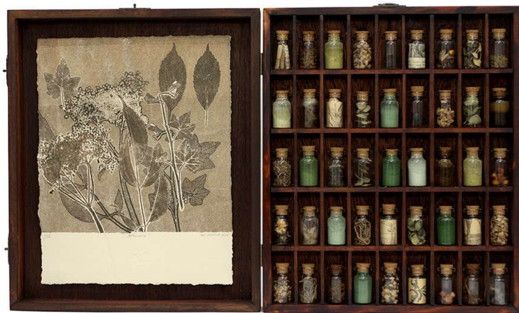
Boticario Monotipo y caja en conservación en madera Monotipo: 27,5 x 20,5 cm Caja: 55,6 x 33,2 cm 2023