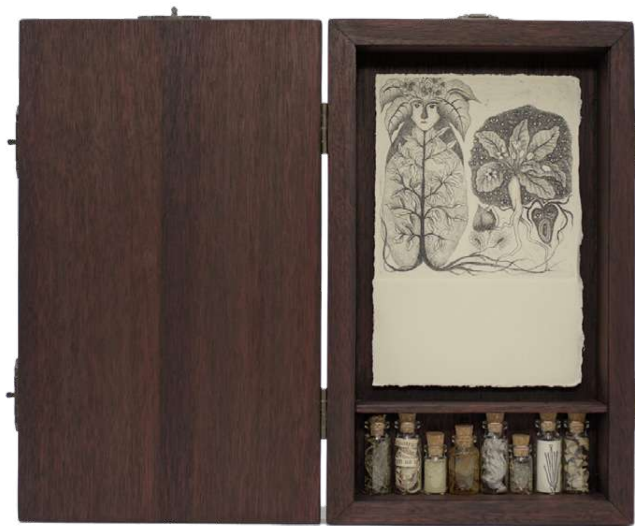
Boticario Mandrágora Caja de conservación y grabado al aguafuente 3/12 15 x 24,5 cm 2022