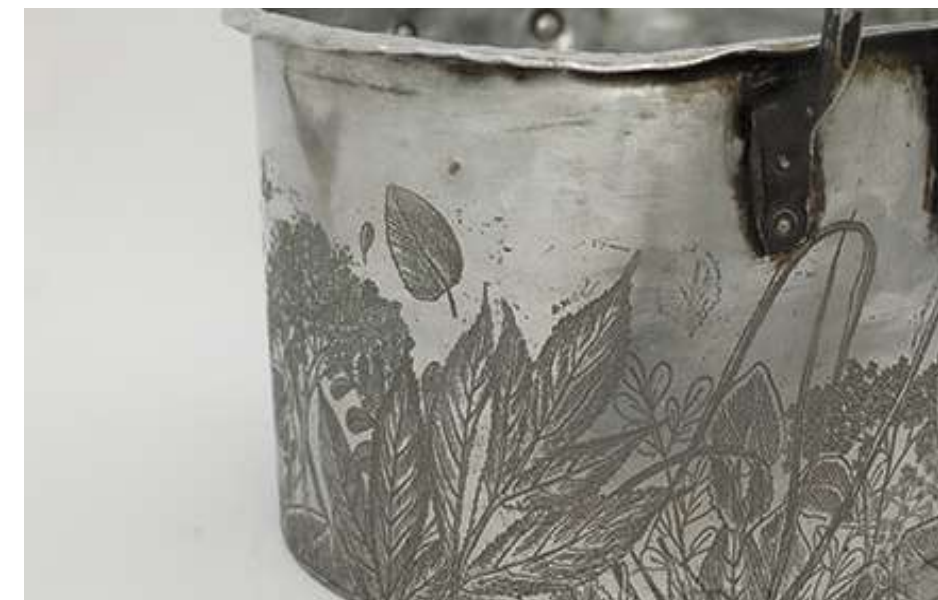
Olla 1 de la serie "Brebajes" Olla gravada al aguafuerte 39,1 x 32,3 x 24,3 cm 2023