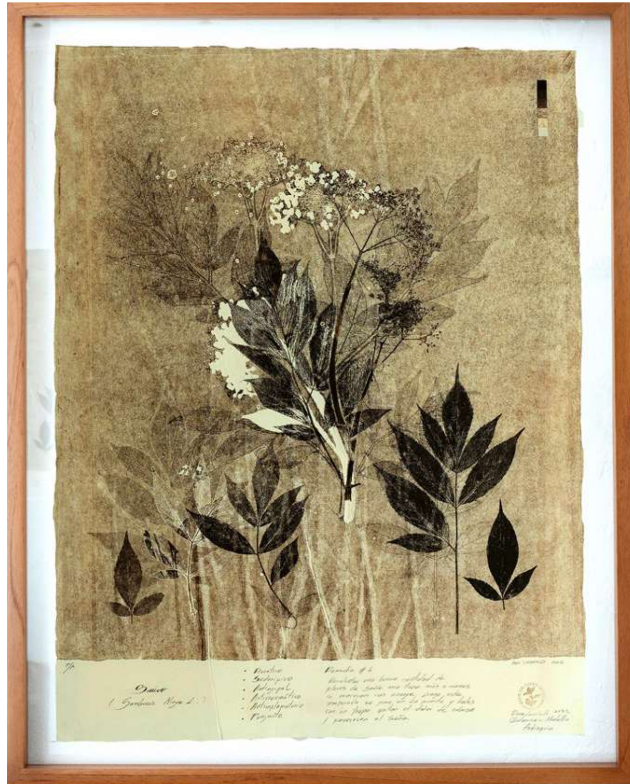
Sauco I Monotipo 64,4 x 80,9 cm (enmarcado) 2022