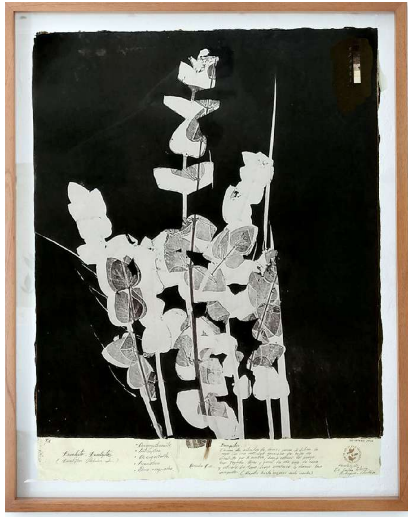
Eucalipto II Monotipo 64,4 x 80,9 cm (enmarcado) 2022