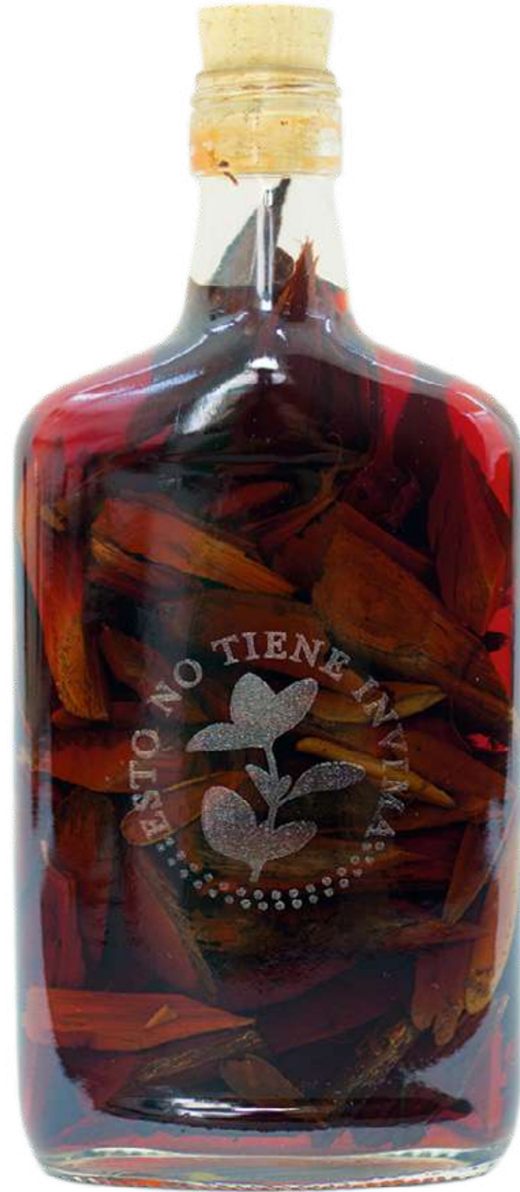
De la serie "Botellas Curadas" Serie de 8 fotografías 27,8 x 40,9 cm (enmarcado) 2023