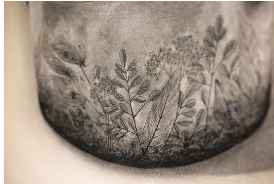
La cura Dibujo al carboncillo 60 x 83,5 cm 2023