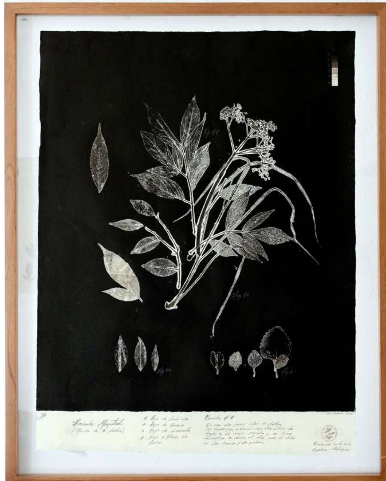
Formula Magistral Monotipo 64,4 x 80,9 cm (enmarcado) 2022