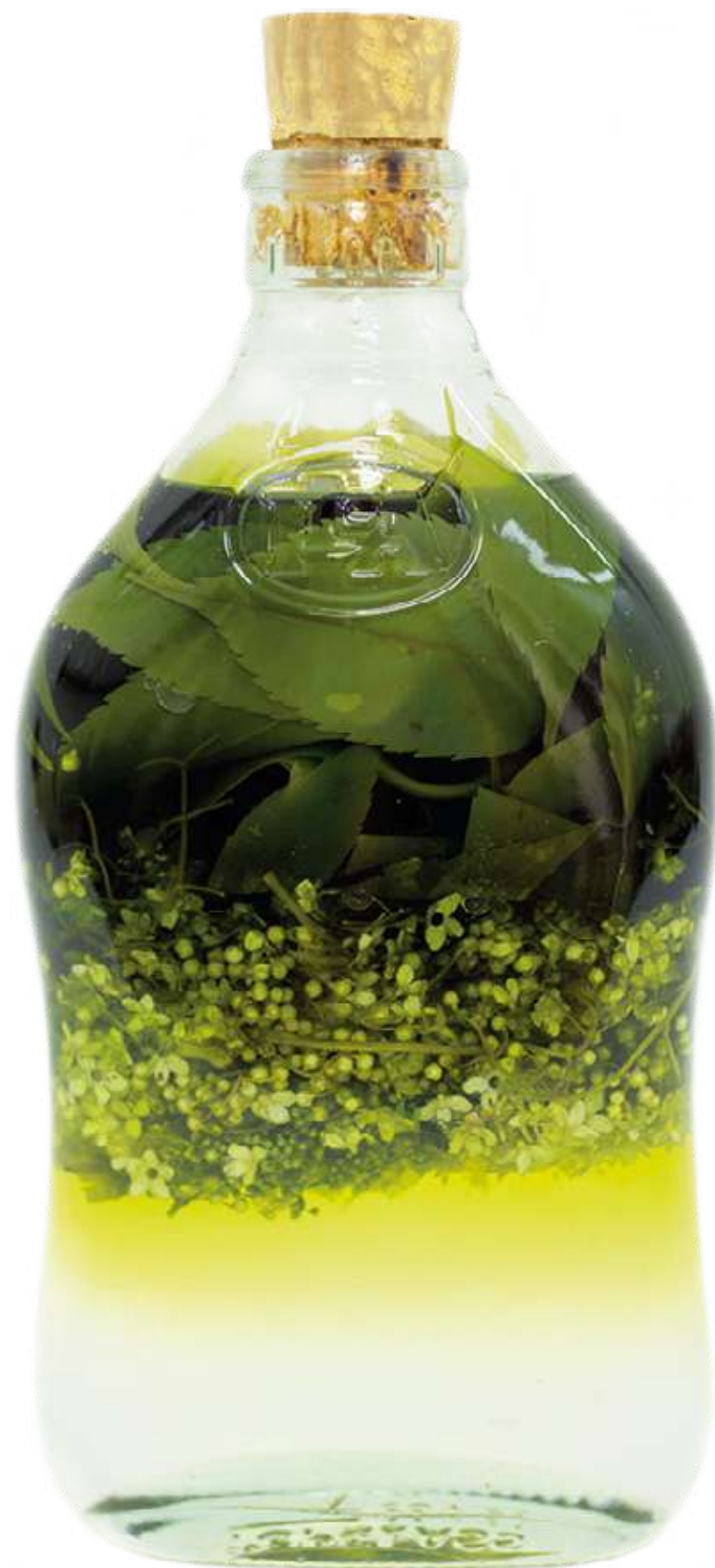
De la serie "Botellas Curadas" Serie de 8 fotografías 27,8 x 40,9 cm (enmarcado) 2023