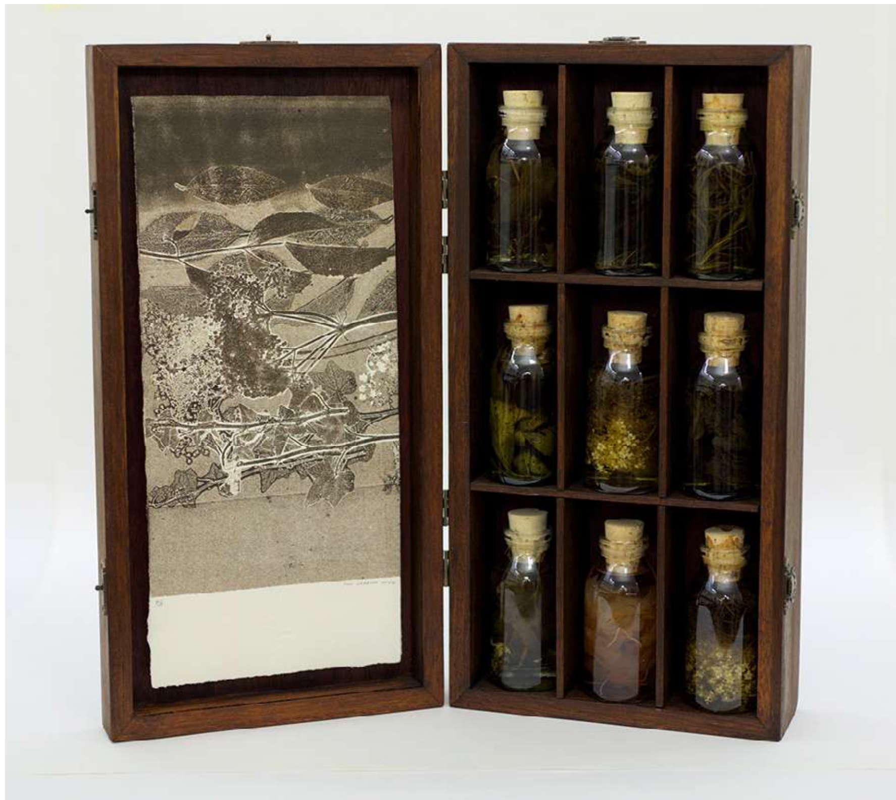
De la abuela Monotipo y caja en conservación en madera Caja: 43,6 x 42,8 x 7 cm 2023