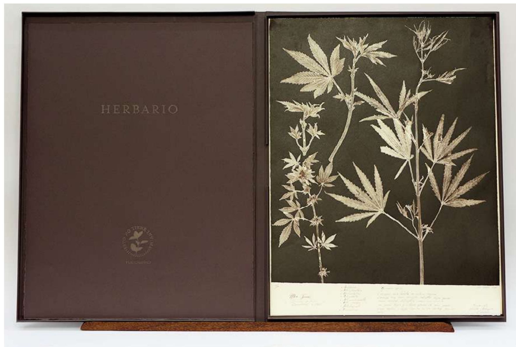
Herbario Carpeta de conservación con monotipo Carpeta: 112 x 73 cm Monotipo: 52,6 x 69,1 cm 2023