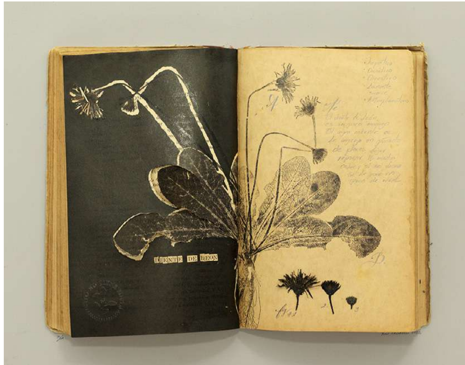
Diente de león Libro intervenido y collage 31,7 x 40,3 cm (enmarcado) 2023