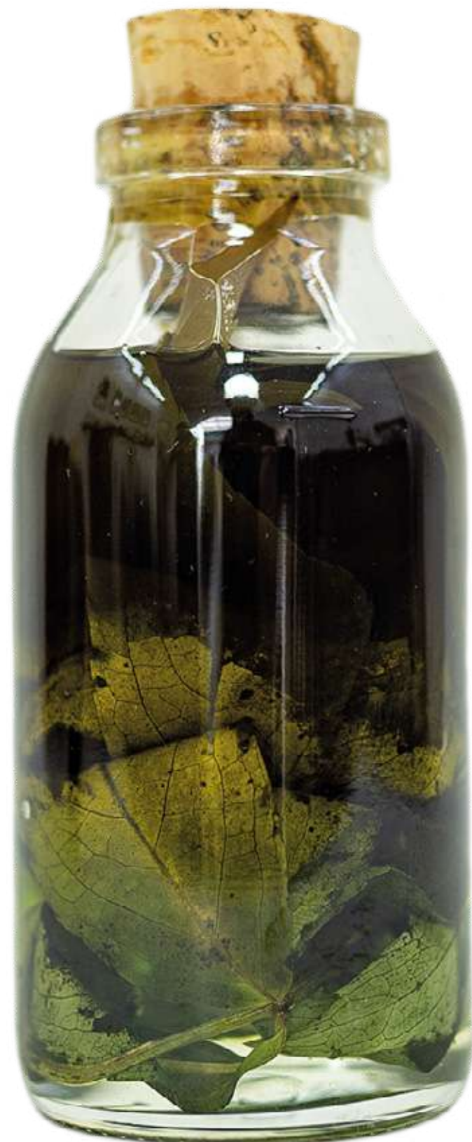
De la serie "Botellas Curadas" Serie de 8 fotografías 27,8 x 40,9 cm (enmarcado) 2023