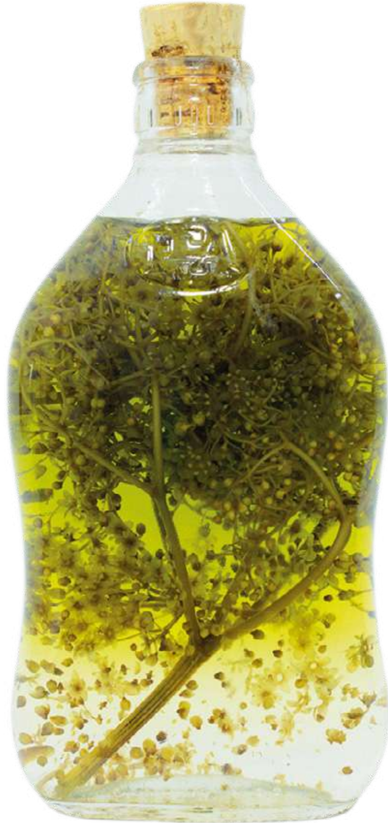
De la serie "Botellas Curadas" Serie de 8 fotografías 27,8 x 40,9 cm (enmarcado) 2023