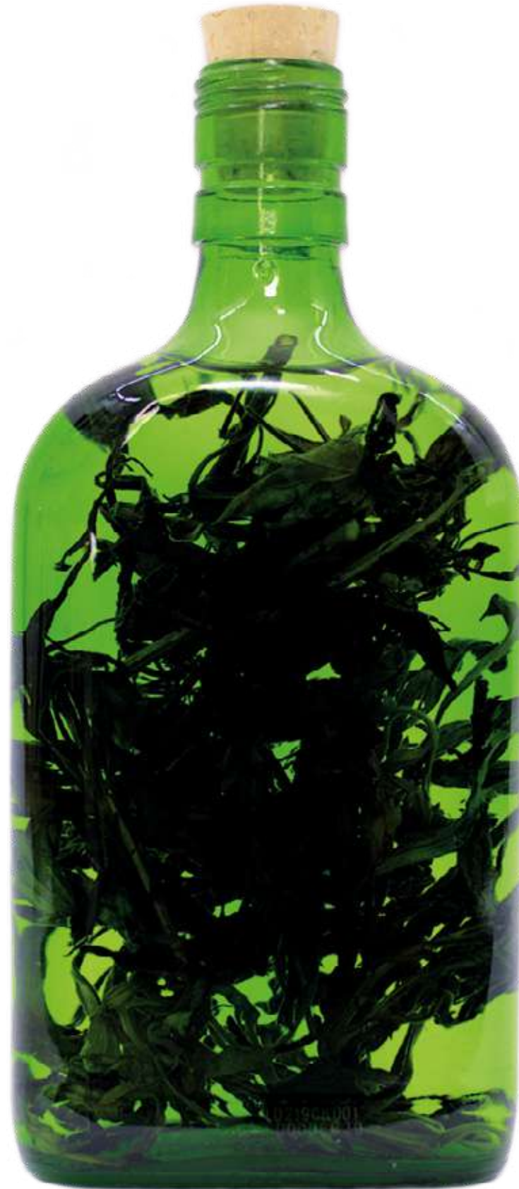
De la serie "Botellas Curadas" Serie de 8 fotografías 27,8 x 40,9 cm (enmarcado) 2023