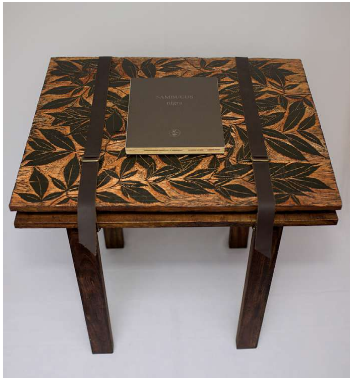
Herbolario Instalación de mesa tallada y concertina Concertina: 24,5 x 29,7 cm Mesa: 77,5 x 61 x 74 cm 2023