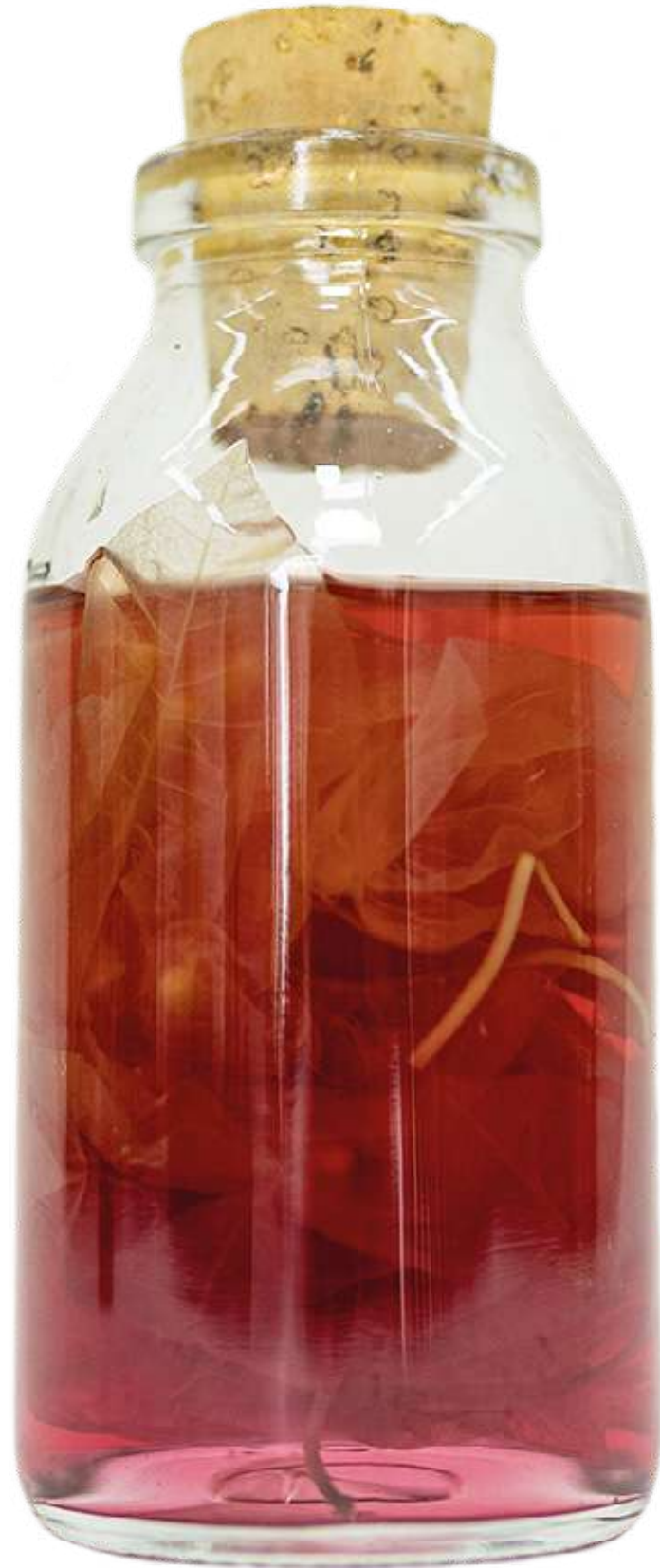
De la serie "Botellas Curadas" Serie de 8 fotografías 27,8 x 40,9 cm (enmarcado) 2023