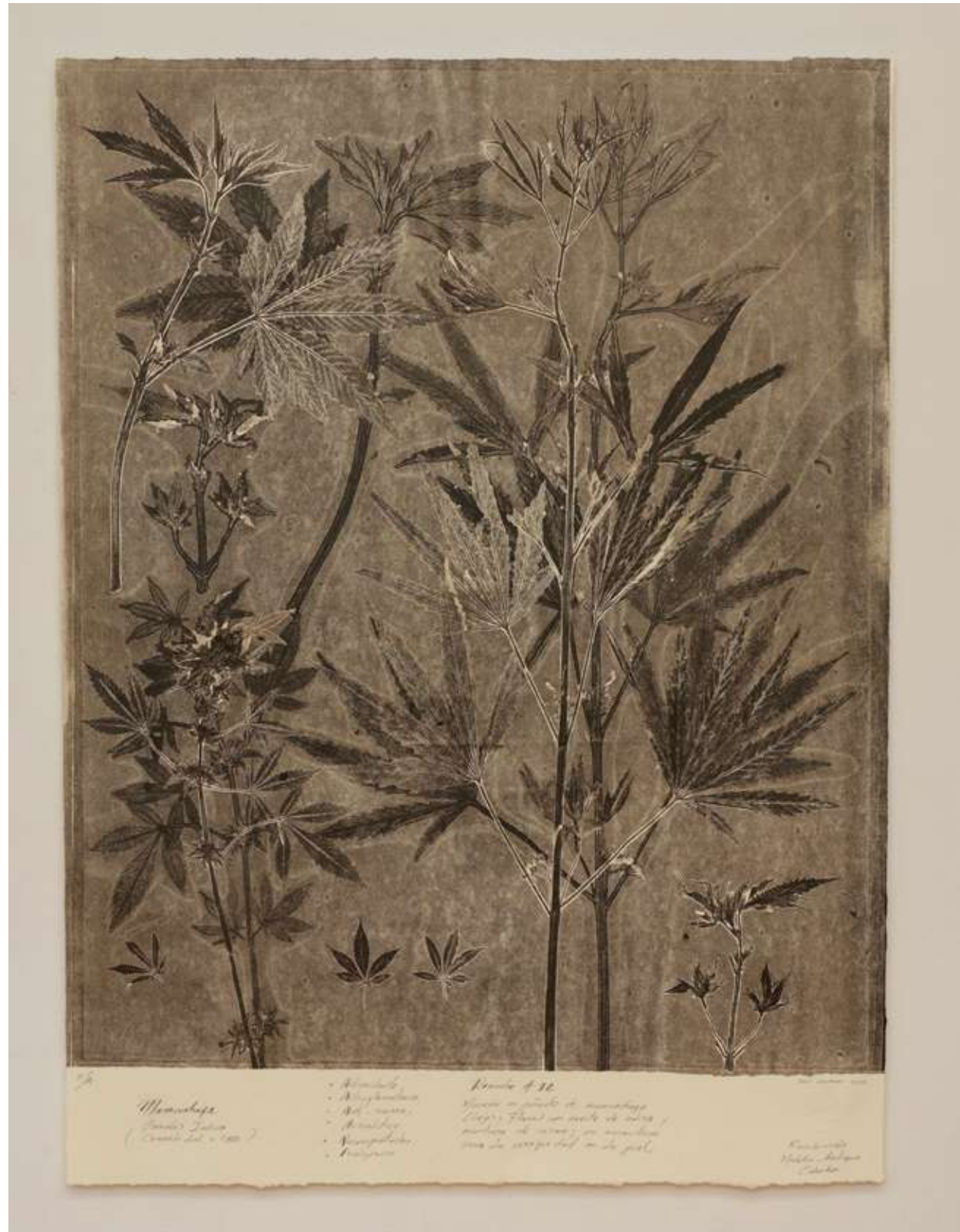
Maracachufa Monotipo 64,4 x 80,9 cm (enmarcado) 2023