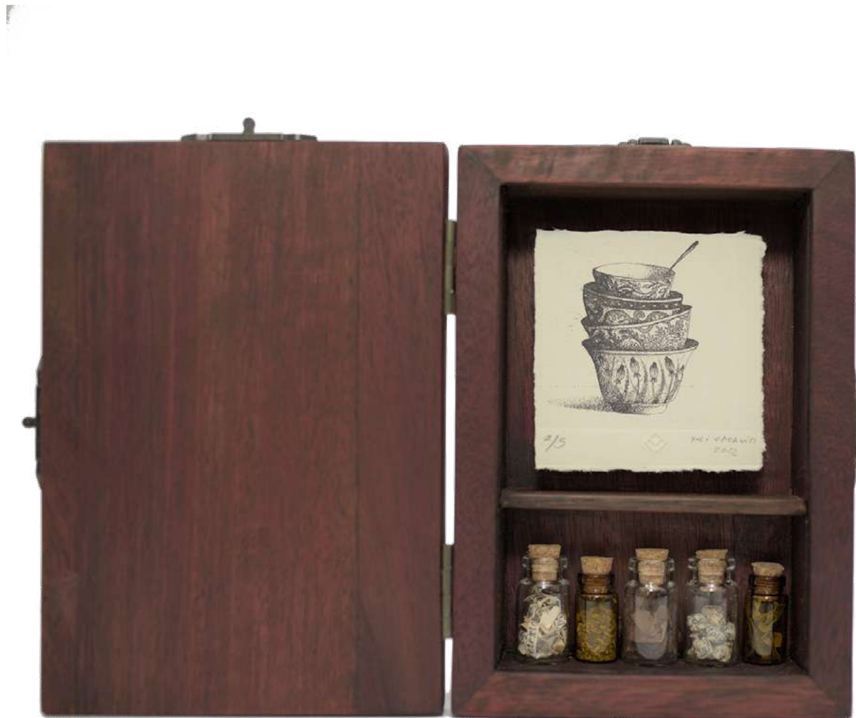
Mini Boticario Caja de conservación y grabado al aguafuente 1/5 10 x 15 cm 2022