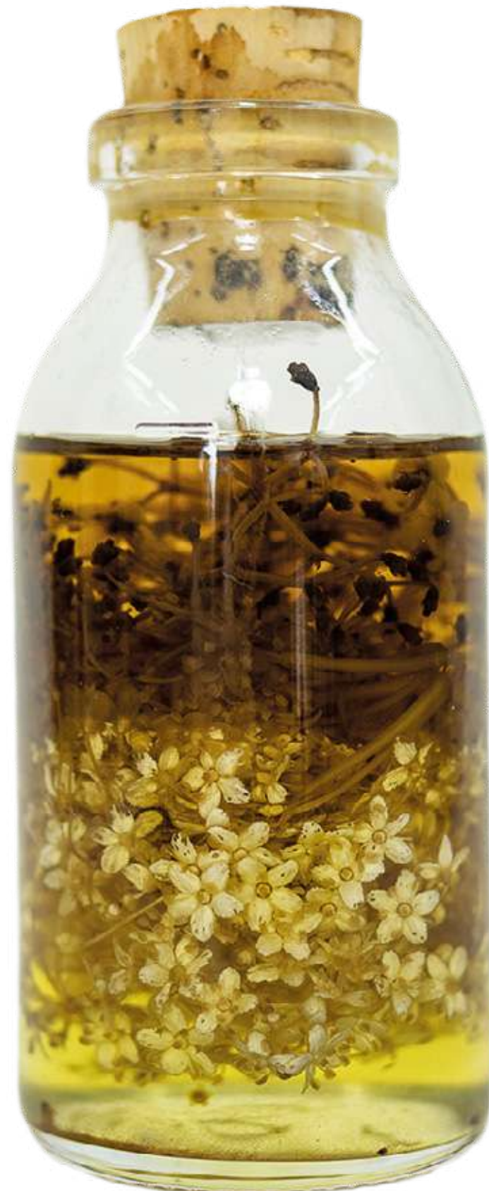
De la serie "Botellas Curadas" Serie de 8 fotografías 27,8 x 40,9 cm (enmarcado) 2023