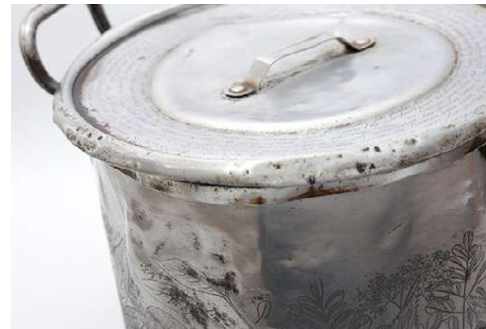
Olla 2 de la serie "Brebajes" Olla gravada al aguafuerte 21,4 x 39,5 x 39,5 cm 2023