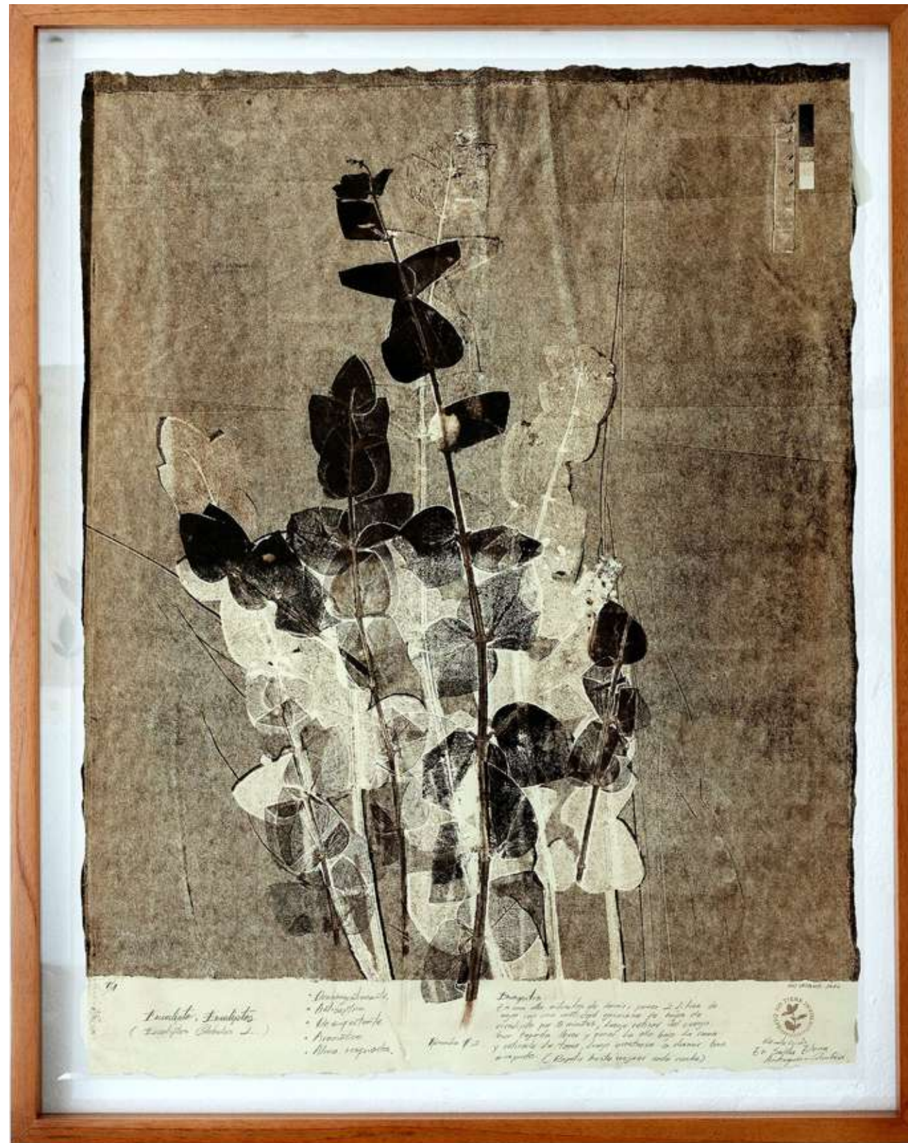
Eucalipto I Monotipo 64,4 x 80,9 cm (enmarcado) 2022