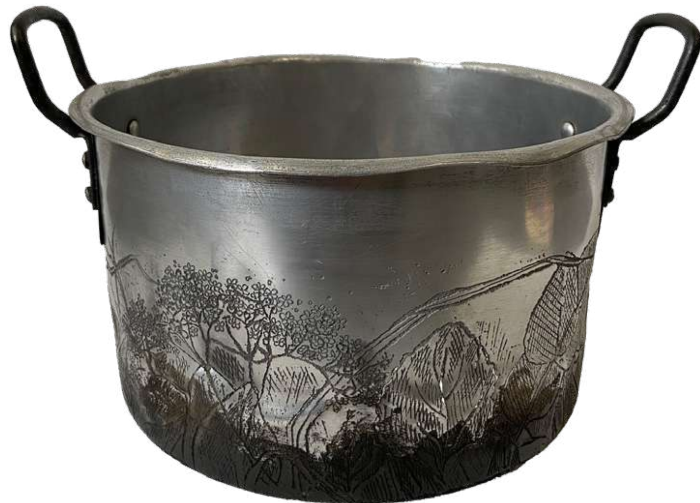
Olla 3 de la serie "Brebajes" Olla gravada al aguafuerte 31,2 x 18,7 x 26 cm 2023