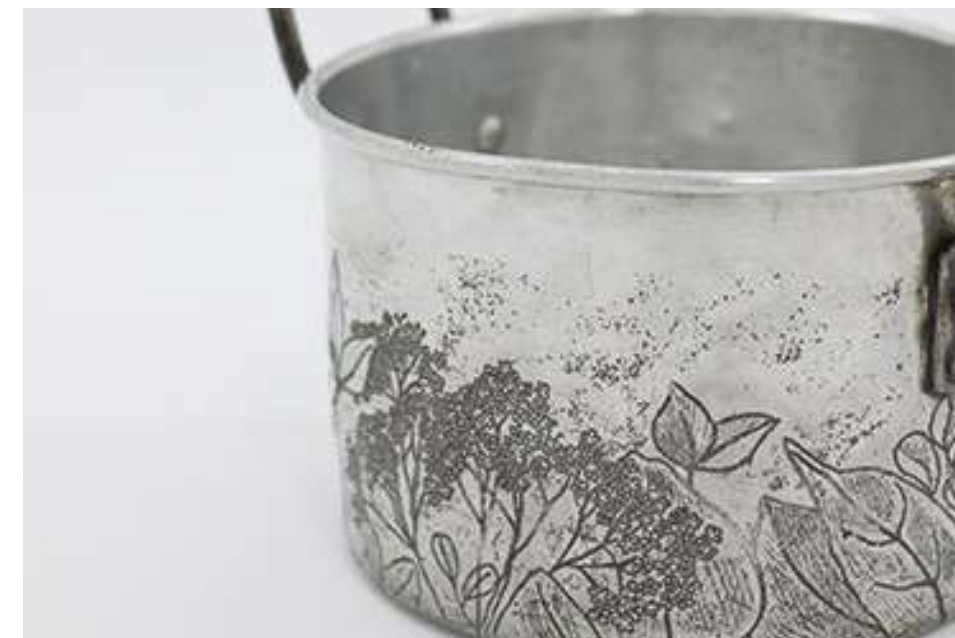
Olla 4 de la serie "Brebajes" Olla gravada al aguafuerte 24 x 15,9 x 18,3 cm 2023