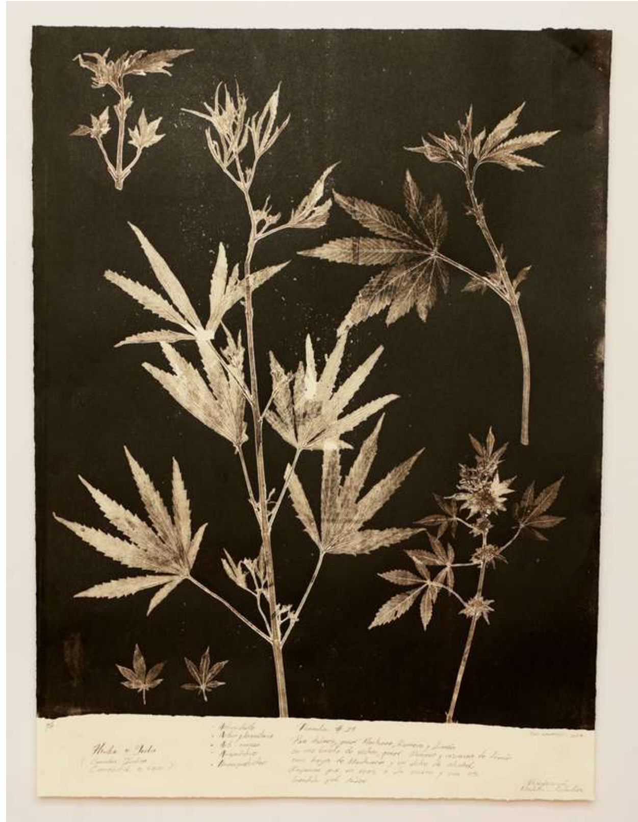
Hierba o yerba Monotipo 64,4 x 80,9 cm (enmarcado) 2023