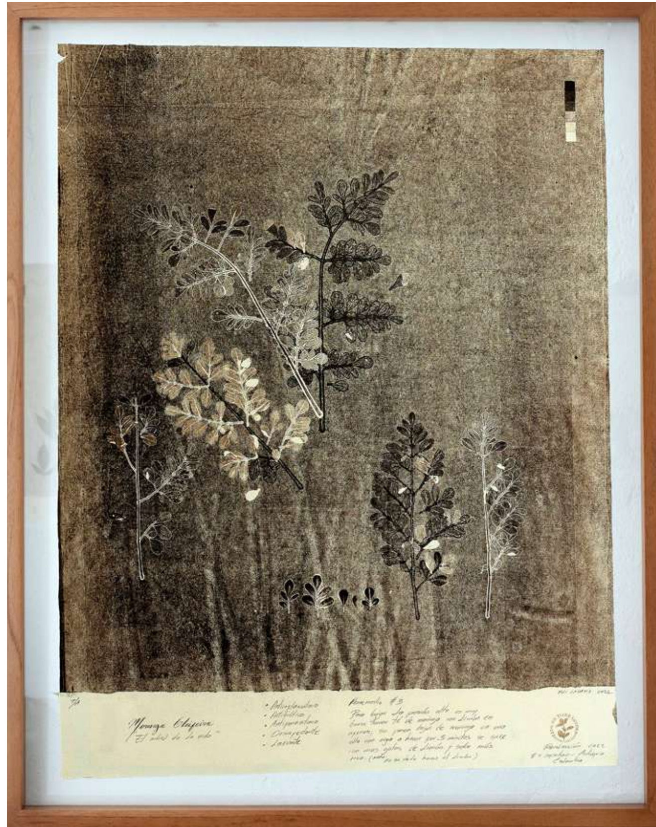
Moringa I Monotipo 64,4 x 80,9 cm (enmarcado) 2022