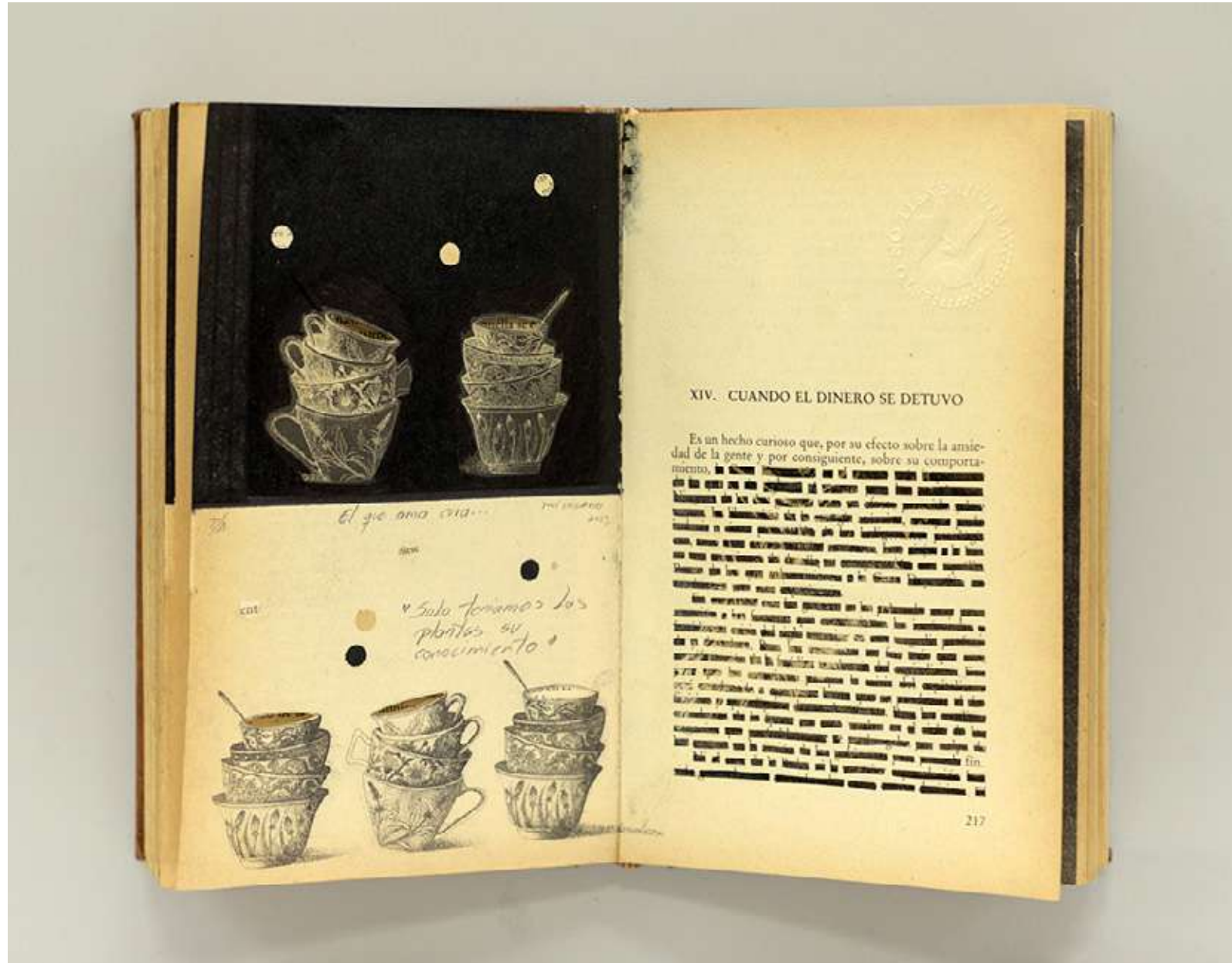
Tres veces al día Libro intervenido y collage 35,9 x 28,3 cm (enmarcado) 2023