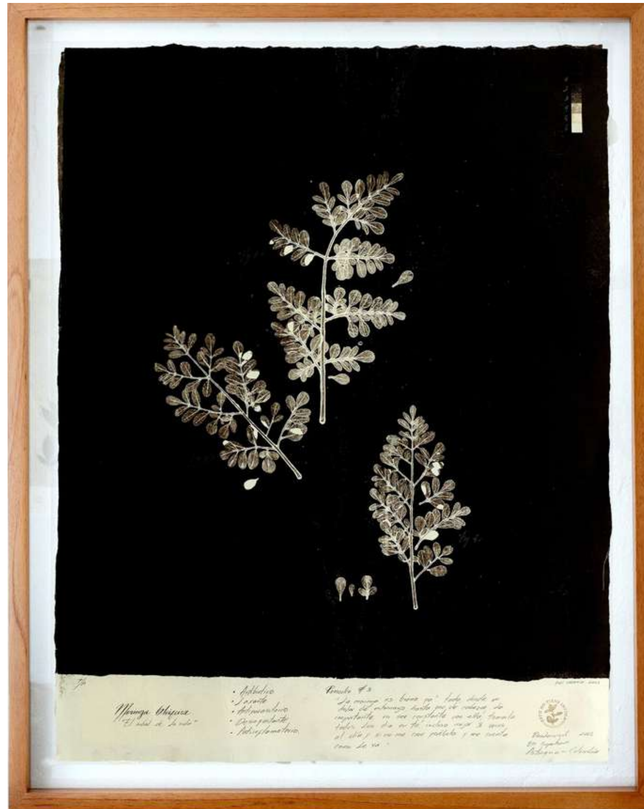
Moringa II Monotipo 64,4 x 80,9 cm (enmarcado) 2022