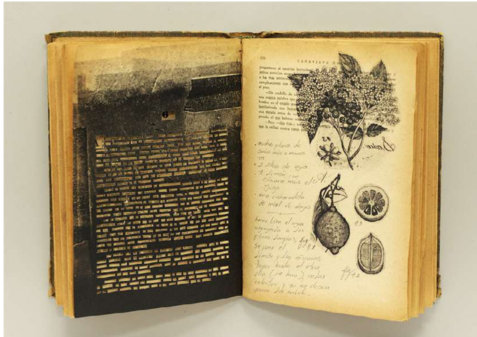
Sauco y limón Libro intervenido y collage 38,8 x 29,1 cm (enmarcado) 2023