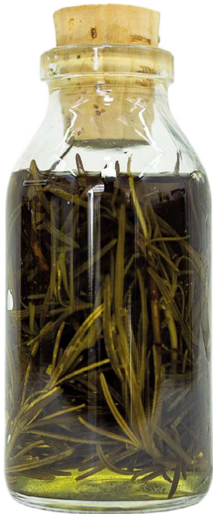
De la serie "Botellas Curadas" Serie de 8 fotografías 27,8 x 40,9 cm (enmarcado) 2023