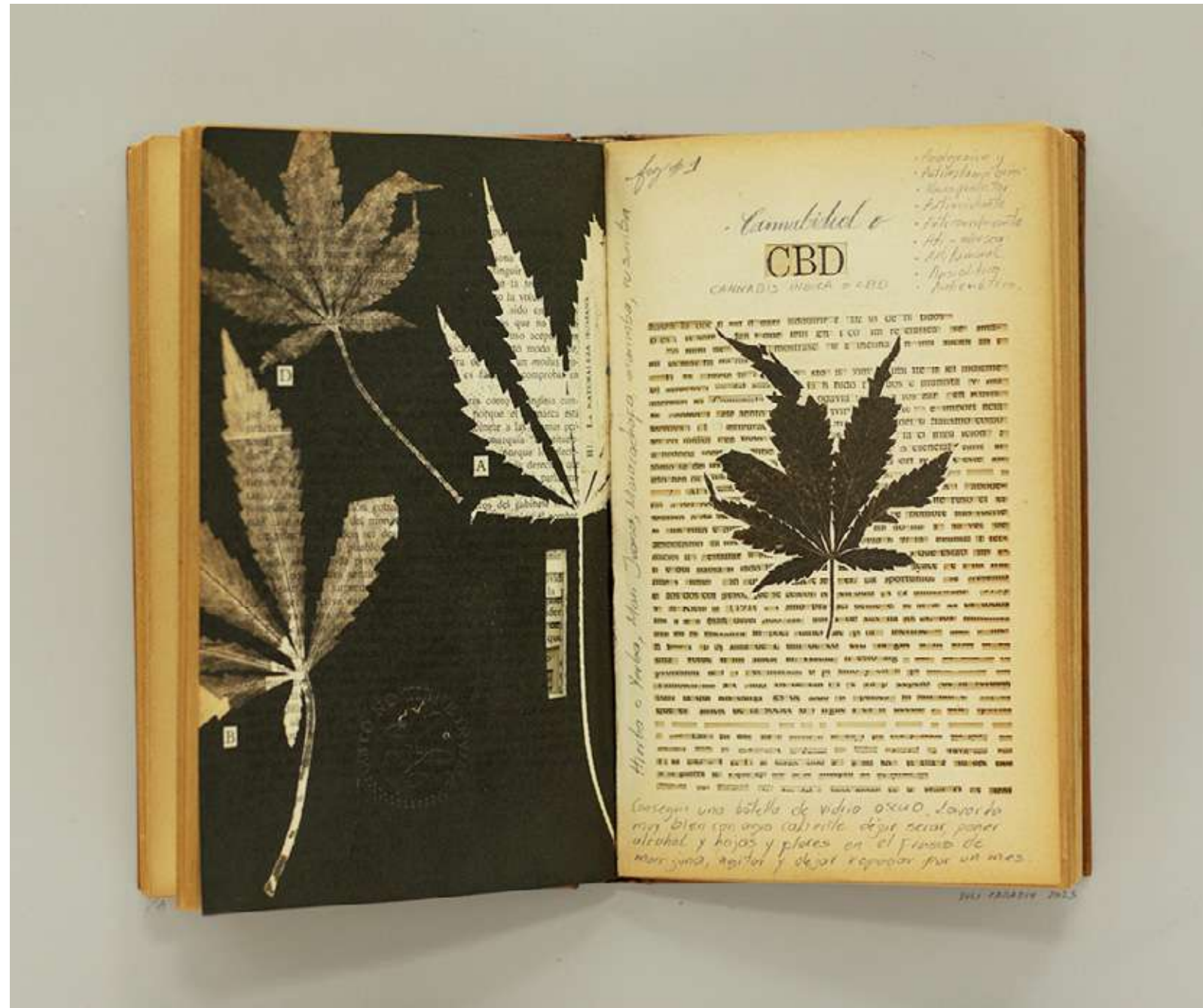
Mari Juana Libro intervenido y collage 35,6 x 39,5 cm (enmarcado) 2023