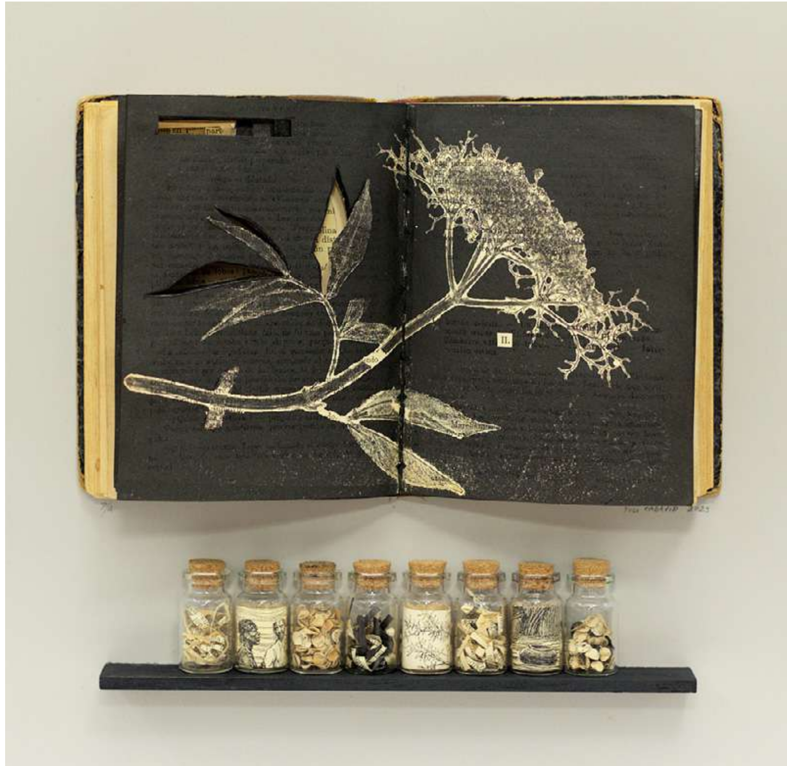
Ramificación Libro intervenido y collage 34,4 x 33,4 cm (enmarcado) 2023