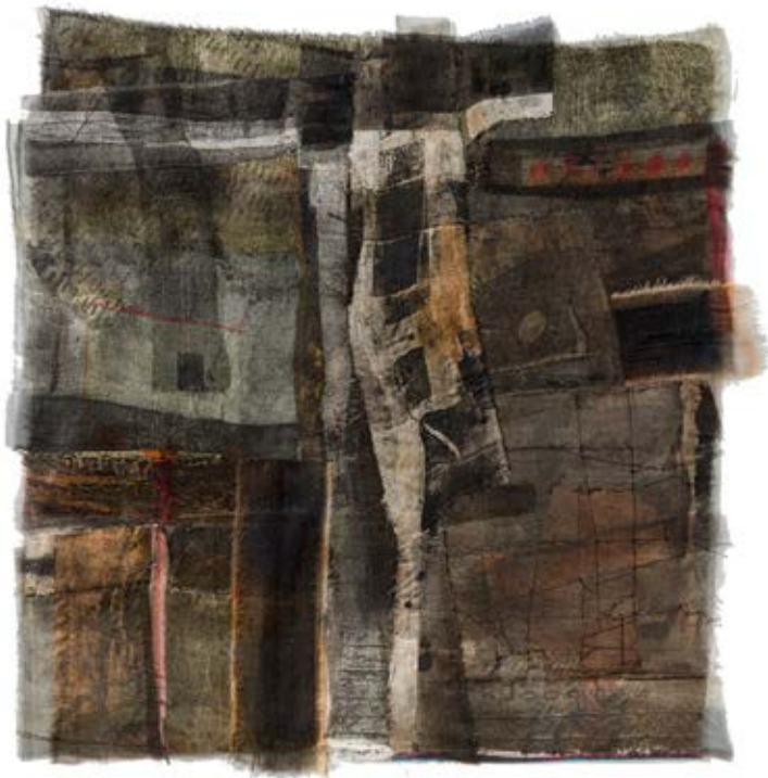
Juliana Correa, Sin título. Serie 'Al Borde', técnica mixta: textiles de algodón y seda natural, hilos de poliéster y algodón, estampación digital, costuras a mano y a máquina. Tinta litográfica y papel carbón. 50 x 50 cm, 2023.

En últimas, esta exposición es una invitación al silencio y a la contemplación, a observar las cualidades acogedoras de la penumbra.